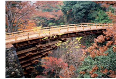
6 猿橋 (日本三奇橋の一つ)