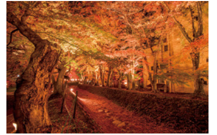
7 河口湖もみじ回廊