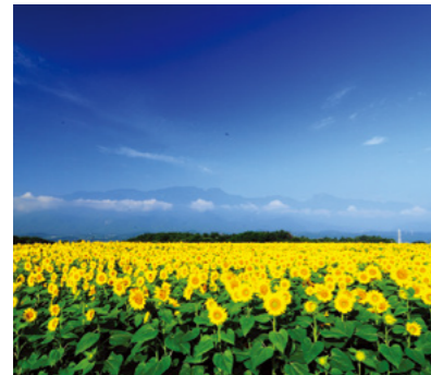
2 明野のヒマワリ畑