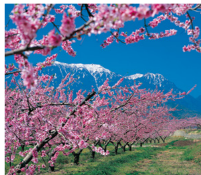
3 新府桃源郷と南アルプス