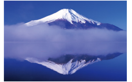
8 山中湖に映る逆さ富士