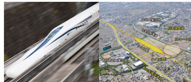
リニア駅周辺整備の概要

そして、リニア駅は中央自動車道や新山梨環状道路などを通じて道路ネットワークと結ばれます。県では、最新技術の動向も注視しながら、県内主要拠点とのさらなるアクセス向上を図っていきます。