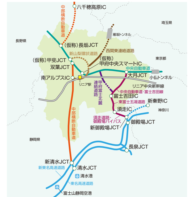
県内外で整備が進む交通ネットワーク

令和 3 年 8 月には、中部横断自動車道 山梨～静岡間が全線開通。静岡県と高速道路で直結したことで、清水港や富士山静岡空港までの所要時間が大幅に短縮され、国内外とのアクセスが飛躍的に向上しました。今後、長坂～八千穂間が開通されると、長野県との新たなルートが開け、さらに大きな効果が期待できます。県では、長野県とつながる中部横断自動車道長坂以北の早期整備を国に対して強く働きかけていきます。