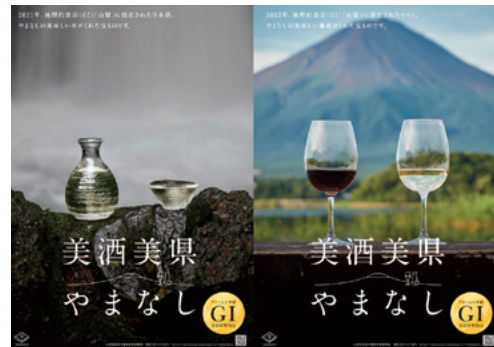
「美酒美県やまなし」として日本酒とワインを PR

お酒の地理的表示 (GI) は、地域の気候や風土、伝統的な製法などを生かして、品質にこだわって生産に取り組んでいる産地を国が指定する制度です。平成 25 年に全国で初めてワインで GI「山梨」が指定され、令和 3 年には日本酒でも GI「山梨」が指定されました。同じ県から2つの酒類で GI が誕生するのも全国初です。これを受け県は、おいしいお酒は美しい自然が育てる「美酒美県やまなし」と銘打ち、本県が誇る美しい自然と匠の技から生み出される高品質な日本酒・ワインを国内外に向けて PR しています。