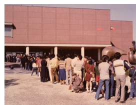
美術館の一般公開に訪れた県民たち