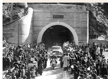
新笹子トンネル開通