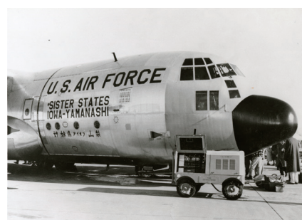
アイオワ州と山梨県が姉妹県と書かれた飛行機