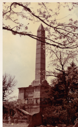
恩賜記念の謝恩碑

令和 元年(2019) 山梨「ワイン県」宣言 2年(2020) 新型コロナウイルス感染症の世界的大流行 3年(2021) 東京2020オリンピック・パラリンピック開催 山梨県が初めてオリンピック競技の開催地となる。 中部横断自動車道 山梨～静岡間全線開通 4年(2022) 「峡東地域の果樹システム」世界農業遺産登録 「無生野の大念仏」ユネスコ無形文化遺産登録 5年(2023) ベトナム社会主義共和国クアンビン省と姉妹締結 人口が43年ぶりに80万人割れ。「人口減少危機突破宣言」