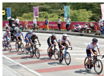
オリンピックの自転車競技ロードレースで県内を走る選手ら

明治 元年(1868) 官軍甲府入城、甲斐府を置く 2年(1869) 甲斐府を廃し甲府県とする 4年(1871) 甲府県を山梨県に改める 5年(1872) 大小切騒動が起こる 6年(1873) 大阪府参事藤村紫朗、山梨県権令となる(翌年県令となる) 10年(1877) 山梨県庁落成。第十国立銀行設立 13年(1880) 明治天皇巡幸 36年(1903) 中央線が甲府駅まで開通 44年(1911) 御料林を山梨県へ御下賜の御沙汰書。中央線新宿～名古屋間全線開通