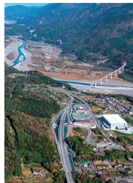
開通した中部横断自動車道