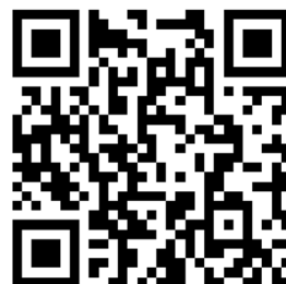
動画 QR コード