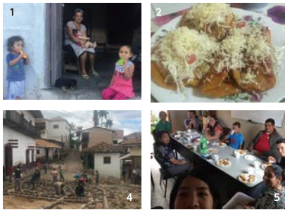
1.お向かいに住む家族 2.軽食は揚げ物が多い 3.公園での探検アクティビティ 4.村の石畳の工事 5.日本に研修に行った同僚のおかえり会