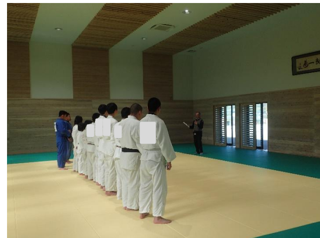
【コーディネーターによる総評】