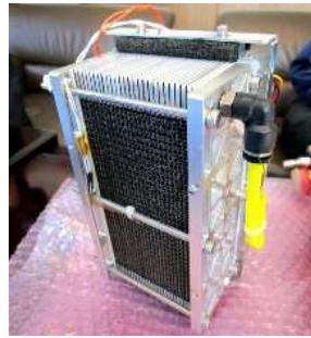
開発中の燃料電池スタック 日刊工業新聞 2020年2月8日

○燃料電池アシスト自転車など小型モビリティの製品化においては、公道など実使用環境を想定した耐久安全性の確認が必要不可欠となる。