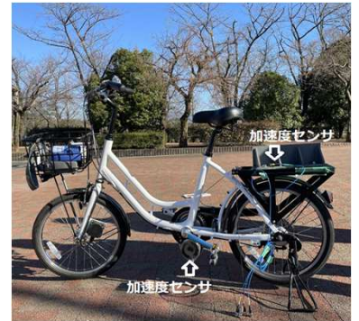
計測に使用した自転車

そこで、本研究では、燃料電池アシスト自転車などの小型モビリティの試作・開発時に必要不可欠となる使用時の耐久安全性を担保するための再現試験方法を検討し、企業による製品の設計開発を支援する。