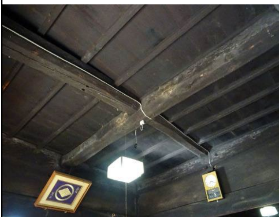
太い梁をあらわにした根太天井 前座敷・居間も同様