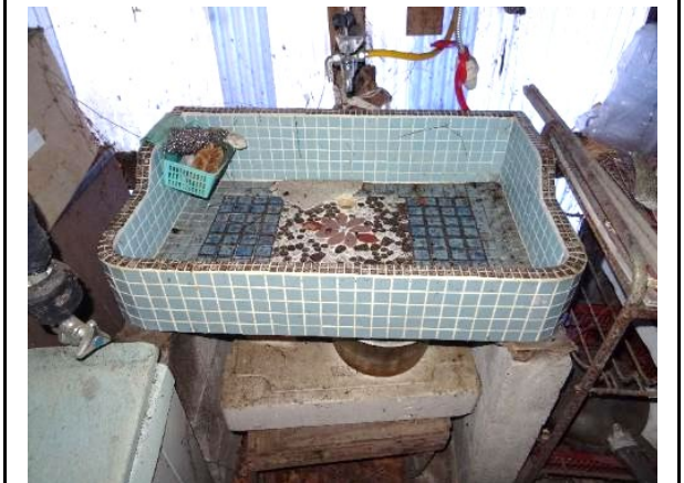
レトロなタイルシンク