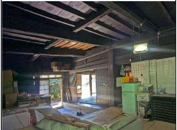
中央に大黒柱 千本格子の建具が残る