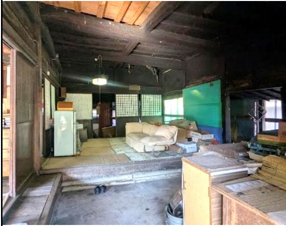
間仕切りのない大空間