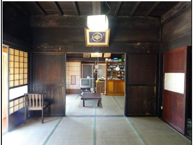
差鴨居が多用されている