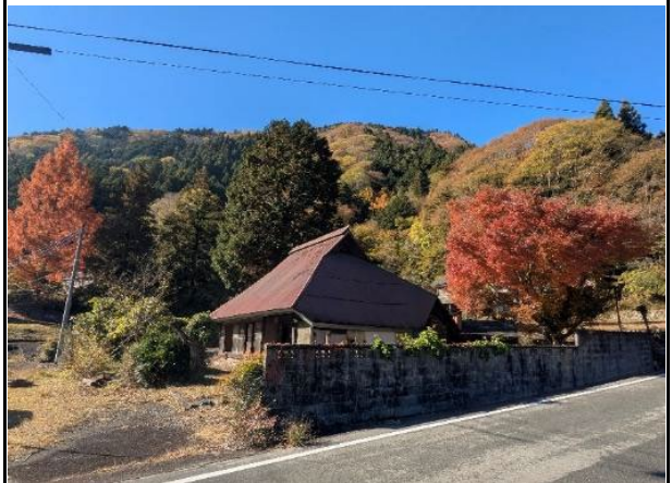
敷地北側の前面道路からの見る 写真左側の砂利敷き範囲に車1～2台駐車可能 敷地北面を整備すればさらに駐車可