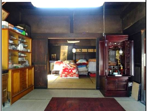
奥座敷には床の間が設えられている