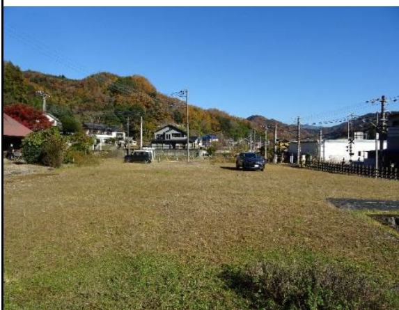
敷地東側に隣接する農地