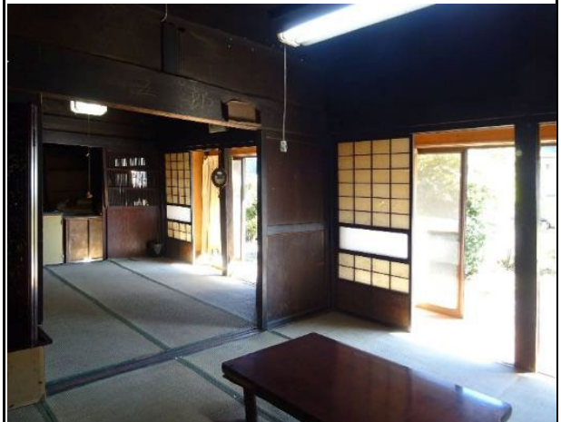
前座敷から前の間・広縁を見る