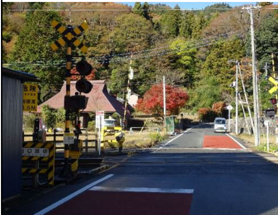
敷地東側の線路を介して建物を見る