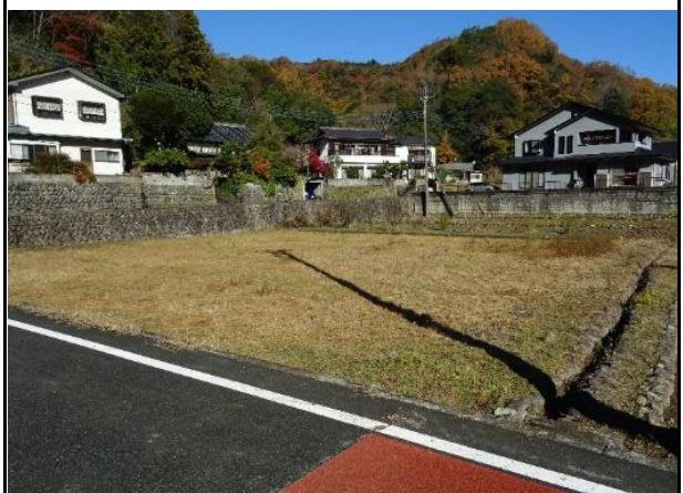
敷地北側に道路を挟んで隣接する農地