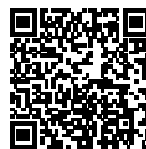
▲省エネ通知のページQRコード