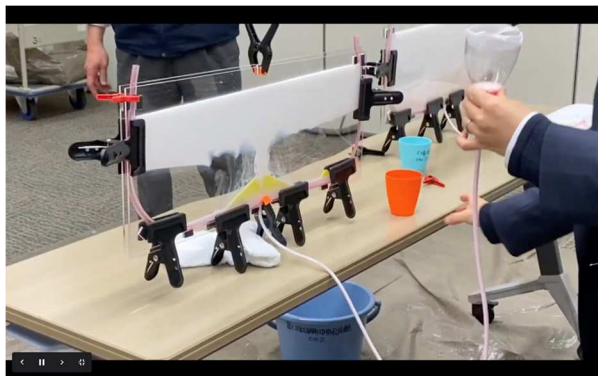
図1 富士山学習研究会での噴煙実験

授業の観察から得られた現状装置の課題について、設計や素材の検討を行い、改良点を反映した試作品を2点製作、組み立て～実験の検証を実施した。装置の改良点として、主に組立をスムーズに行うための防水用チューブの位置やクリップの位置を明確にするガイドの作成、実験時の水漏れや、富士山型の前後に模擬噴煙が入り込むことを防ぎ、装置の耐久性を向上するため素材の変更等を行った。また装置の組み立て方法について理解しやすくすることを目的に説明資料の案を作成した。