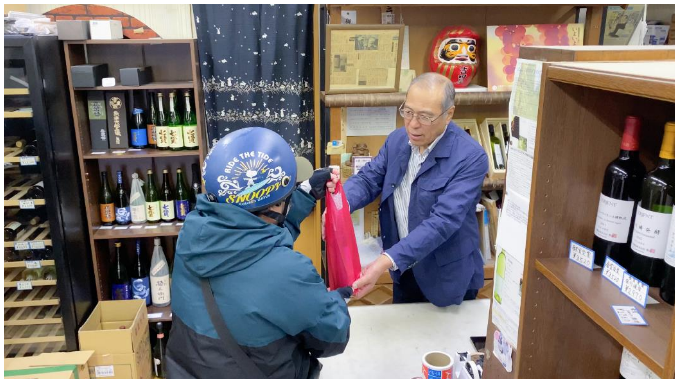
<注文の入った酒店でお買い物代行をする配達パートナーと店主（実証実験の様子）>

即時配送・ラストマイル物流に特化した物流ソリューション事業を展開する株式会社エニキャリア（以下エニキャリア）は、2023年11月10日より実施している山梨県甲府市朝日通り商店街周辺エリアを対象としたお買い物代行サービス「おつかいエニコ」の実証実験において、甲府市で新聞販売事業等を展開する株式会社ニュースコム（以下ニュースコム）と業務提携しました。今回の提携により、お買い物代行依頼の電話受付をニュースコムが2月1日より行います。この実証サービスはエニキャリアが開発・提供する、配達依頼マッチングアプリ「anyCo（エニコ）」を基盤として新たに構築したアプリから簡単にお買い物代行の依頼ができる仕組みです。今回、地域に根差した事業展開をするニュースコムの協力により電話受付を強化することで、アプリに不慣れな地域の高齢者にとっても手軽なサービスとし、利便性向上による利用拡大を図ります。