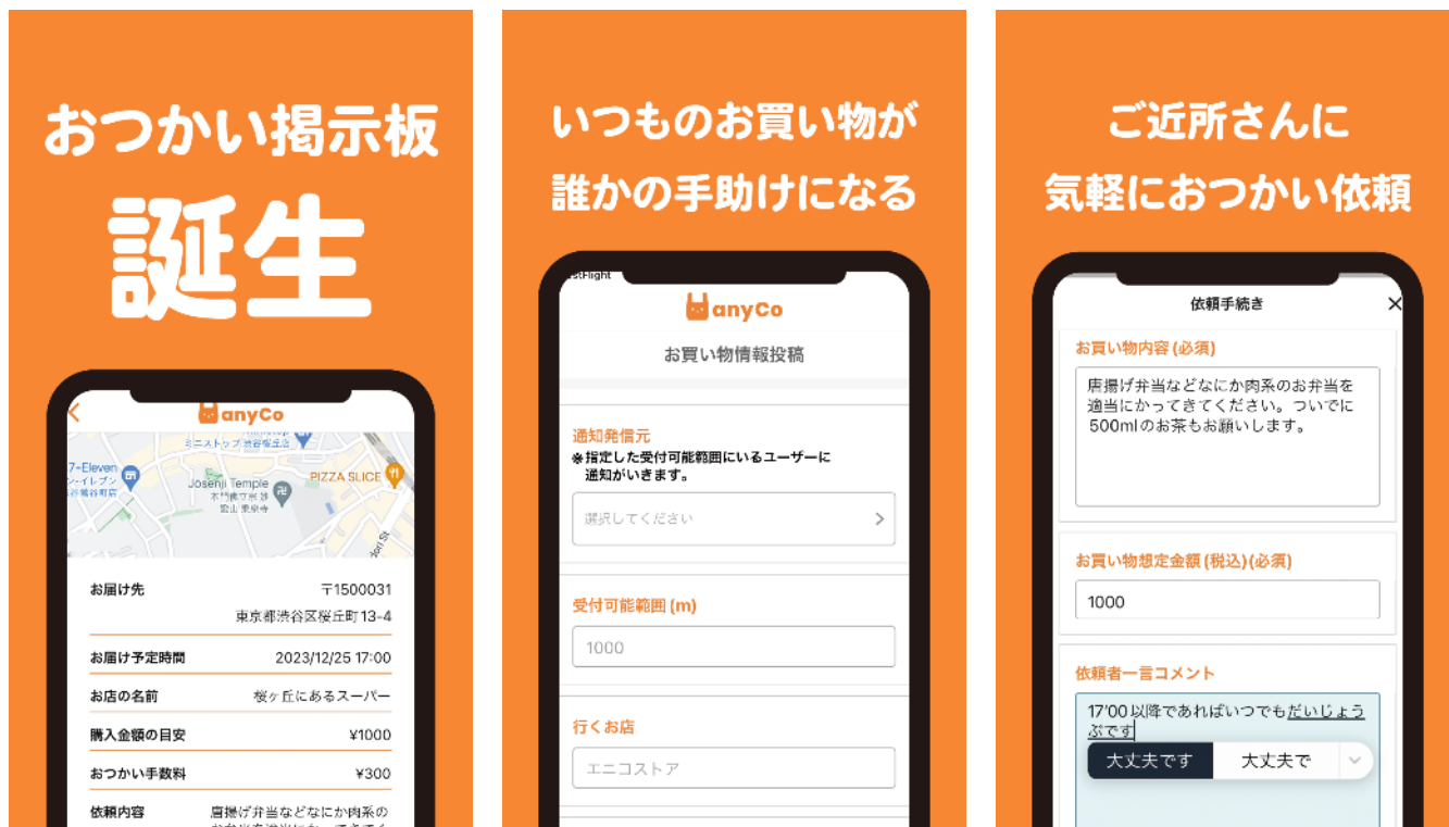
＜地域共助型お買い物アプリ「おつかい掲示板」の画面イメージ＞