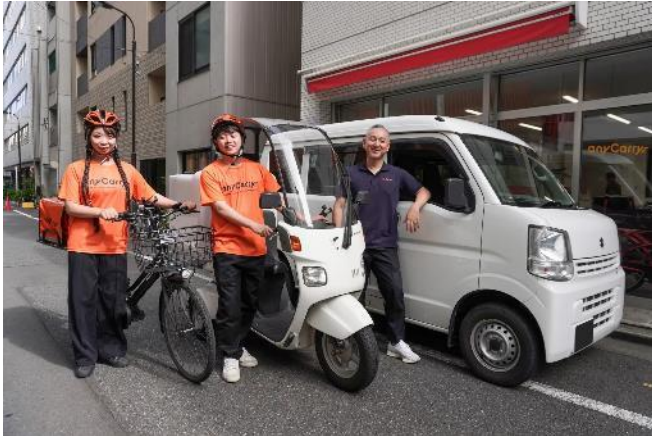
<エニキャリアの配達員（イメージ写真）>