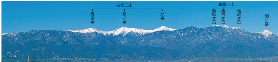
この写真は、八代ふるさと公園(笛吹市)から撮影したものです