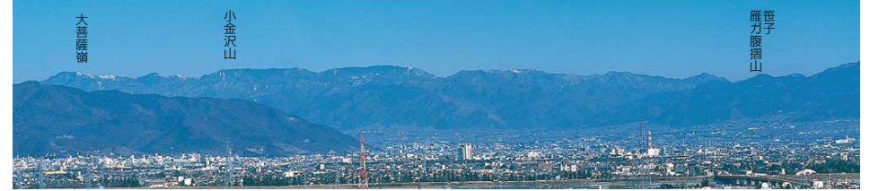
この写真は、中部横断自動車道・白根IC付近から撮影したものです