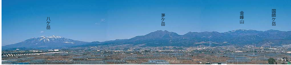
この写真は、中部横断自動車道・白根IC付近から撮影したものです

山梨県は周囲を急峻な山々に囲まれています。北東部に秩父山塊、西部に3,000m級の山々からなる南アルプス、南部には世界遺産富士山、そして北部には八ヶ岳、茅ヶ岳が広い裾野をひいています。これらの山地は山岳、森林、湖沼、渓谷などの優れた景観に富み、富士箱根伊豆国立公園などの自然公園にも指定されています。