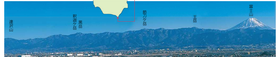
この写真は、中部横断自動車道・白根IC付近から撮影したものです