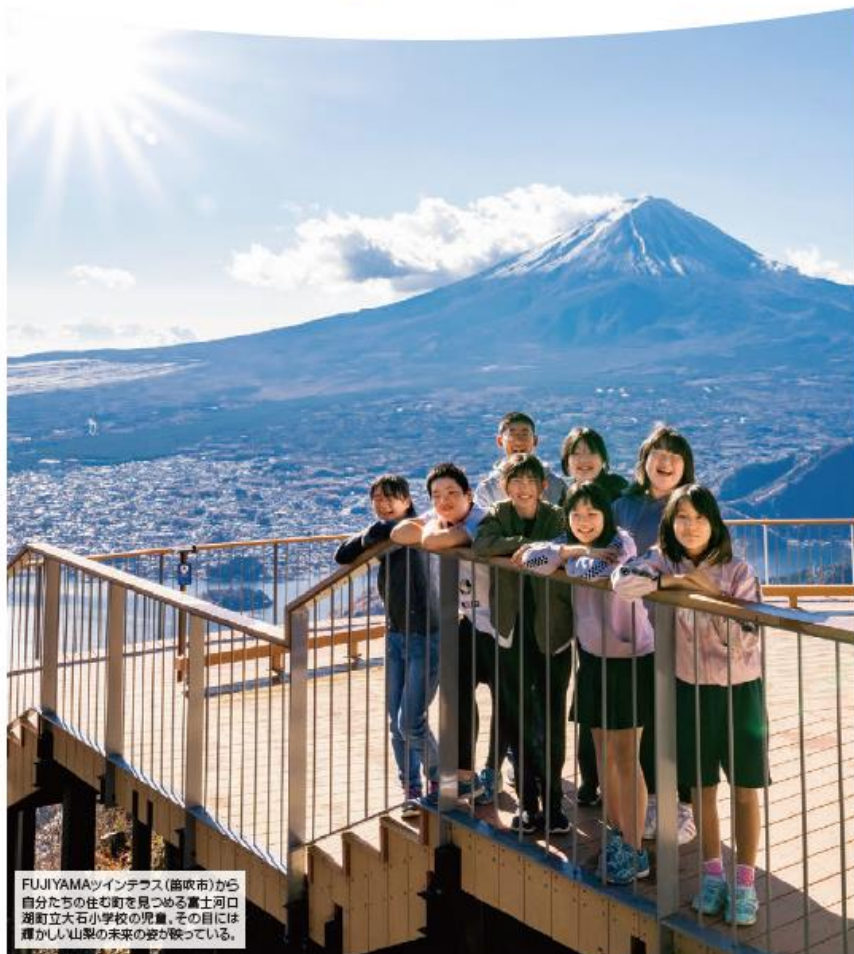
FUJIYAMAツインテラス(笛吹市)から自分たちの住む町を見つめる富士河口湖町立大石小学校の児童。その目には輝かしい山梨の未来の姿が映っている。