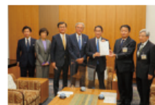
岸田首相に要望書を呈する県庁

今後とも関係都道府県と連携し、国と一体となって火山防災対策に取り組み、噴火による被害の軽減を図ってまいります。