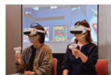
VR機器で作品を鑑賞する様子 パソコンやスマートフォンなどで体験できる

新たな価値創造の一環として、昨年11月、同館では仮想空間(メタバース)上のギャラリートークでは、本県出身現代美術作家の作品を基からの展示鑑賞のほか、複数人で仮想空間内を移動やコミュニケーションを体験できます。2月末にVR機器を設置するなど、現実の美術館と連