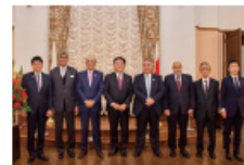
来県した中東諸国の大使たち

県ではこうした事業を通じて中東諸国との交流を深め、日本と各国の架け橋になれるよう取り組んでいきます。