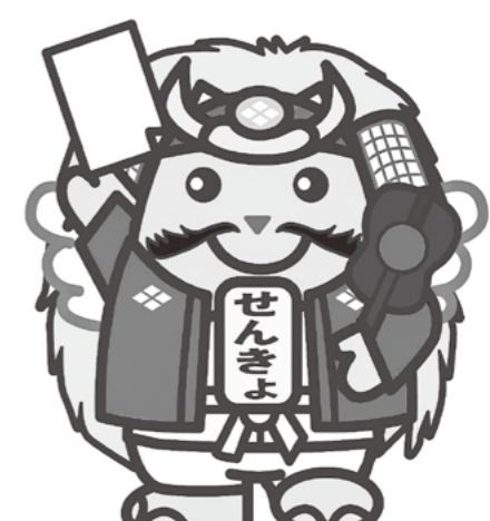
武田信玄めいすいくん