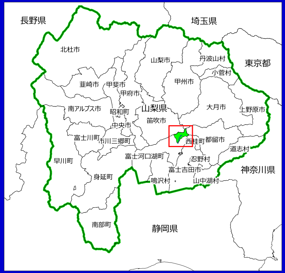
相模川水系 西川 洪水浸水想定区域図（浸水継続時間）