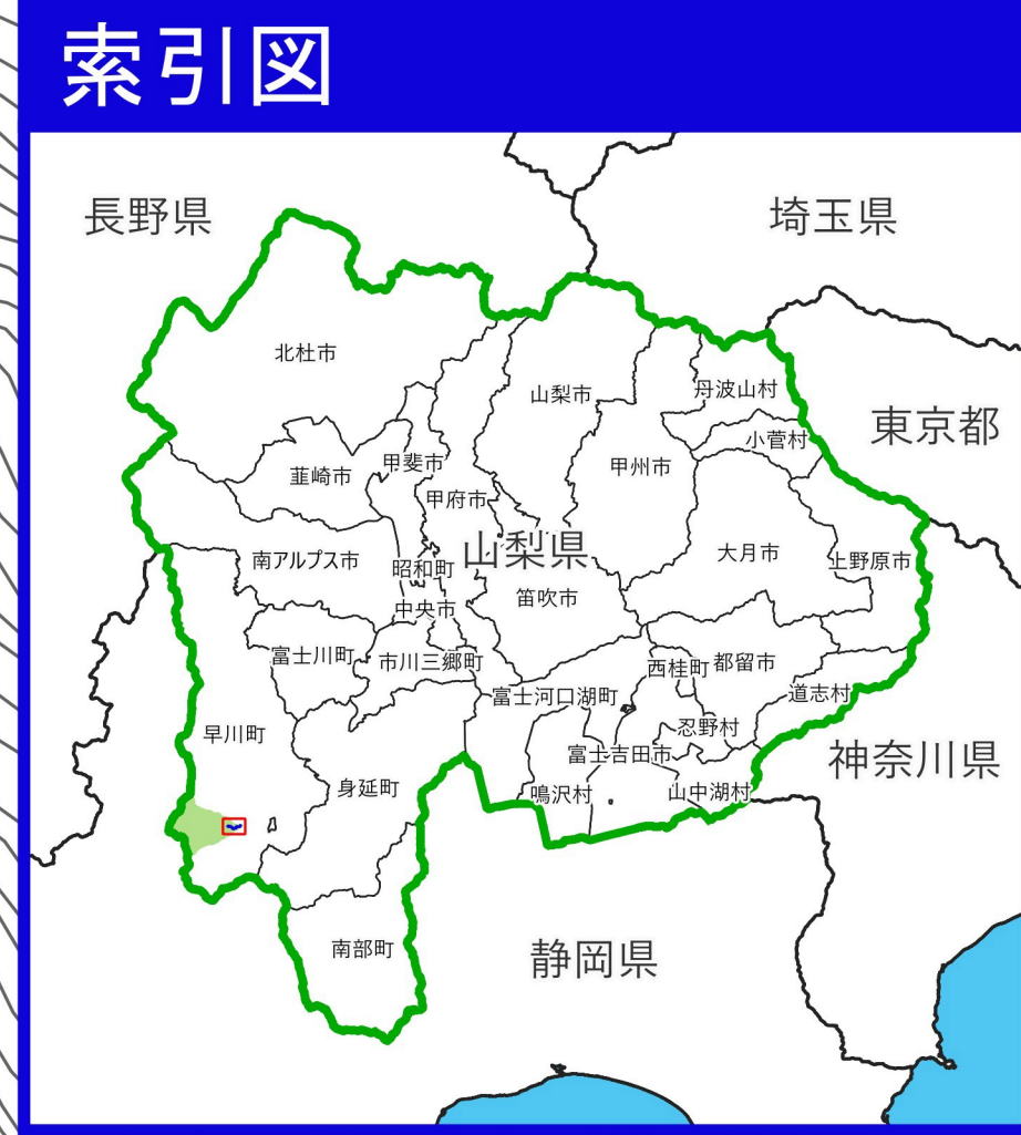
富士川水系稲又谷川洪水浸水想定区域図（想定最大規模）