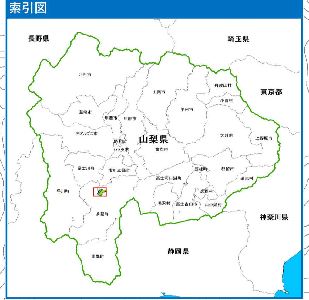
富士川水系 田原川 洪水浸水想定区域図 (想定最大規模)