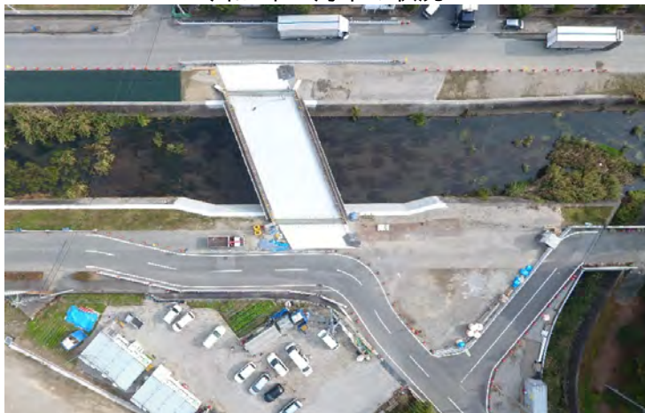
令和4年10月末の状況