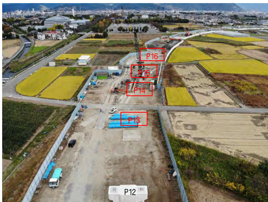
【 上空からドローンにて現場を撮影 】

現在、当工事においては11月中旬頃まで場所打杭の作業予定であり その後は橋脚躯体工の作業に入ります。 地域の皆様やご通行の皆様方にはご不便ご迷惑をお掛けしているところでは ございますが、安全第一で工事の進捗を図って参りたいと思っておりますので 何卒ご協力のほどよろしくお願いいたします。