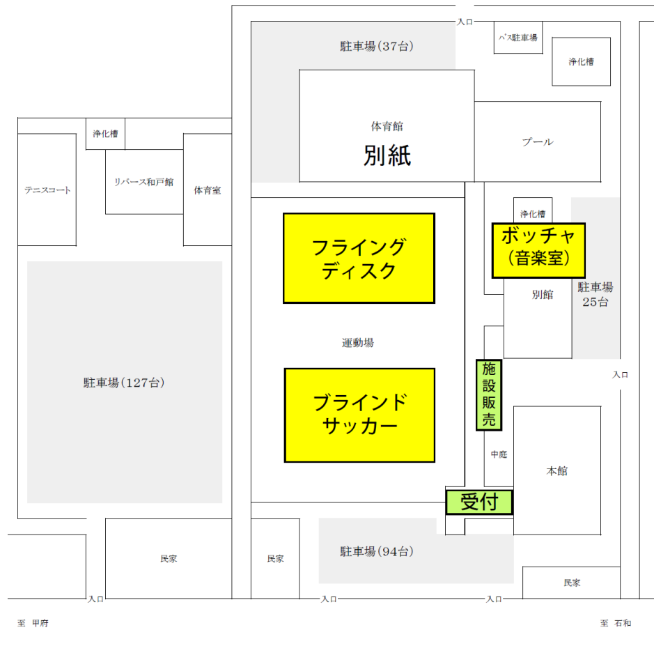
青少年センター配置図