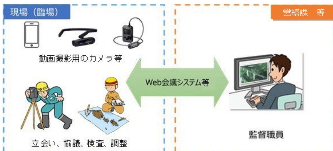
図 3-1 機器構成（例）

なお、Web 会議システム等については、公共工事、公共発注機関等で活用実績があるなど、十分な情報セキュリティが確保されたものとする。