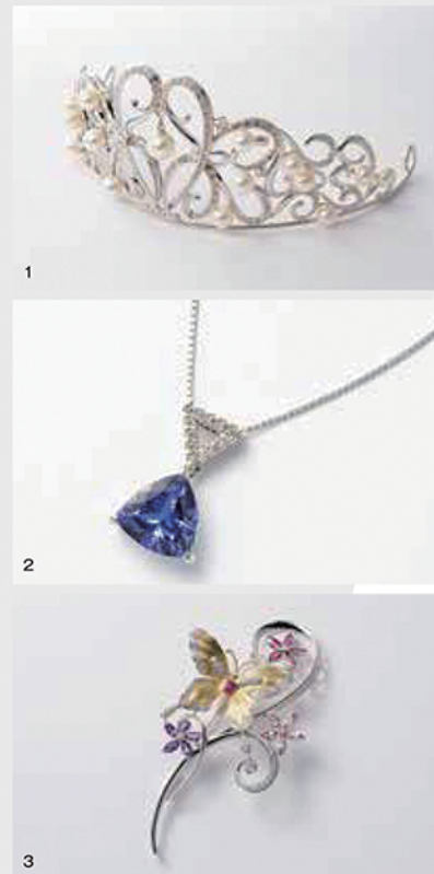
1.「真珠のティアラ」 デザイン・制作:ジュエリー工房藤島 藤島和廣 2.「ネックレス」 デザイン・制作:株式会社ジュエリープランニング 3.「春風に舞う」 デザイン:西美由紀 制作:ジュエリーフルヤ 古屋孝夫

企画展では全29種類の誕生石をもちいたジュエリーが並びます。ジュエリーに興味を抱ききっかけとして誕生石を知った思い出や誕生日を知って「誕生石は…」なんて会話を交わした記憶がある方もいらっしゃるでしょう。ジュエリーを選ぶたのしみ、身につけたのしみなどの一つのきっかけとして、誕生石を取り入れてみるのはいかがでしょうか。