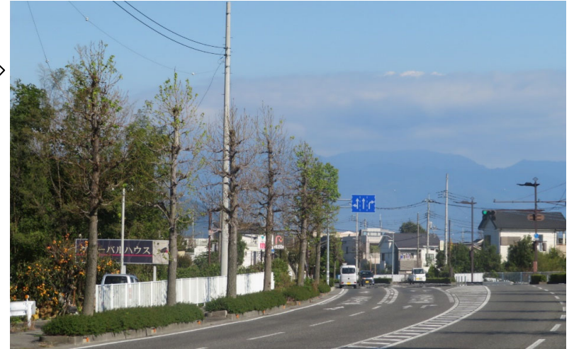
【写真②】災害時に倒壊の恐れのある電柱