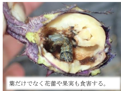
図2 ハスモンヨトウの形態と被害