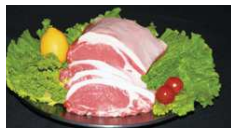
甲州富士桜ポーク