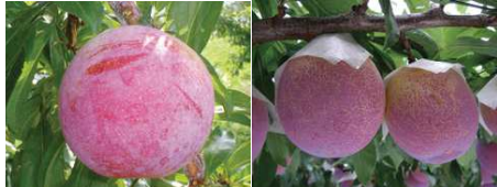
サマーエンジェル

栽培面積、生産量ともに日本一です。スモモの常識を覆すほど大玉で高糖度の「貴陽」や「太陽」、県オリジナル品種の「サマーエンジェル」「皇寿」が注目されています。