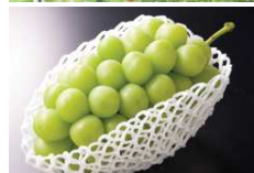
(上)甲州 (下)シャインマスカット