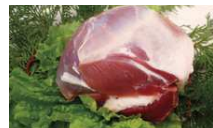
やまなしジビエ(シカ肉)