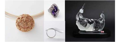
Koo-fu(クーフー)コレクション

山梨県は、宝石の加工と貴金属加工が一体となった産地であり、研磨宝飾製品では、国内屈指の出荷額を誇っています。さまざまなジュエリーに加え、国の伝統的工芸品に指定されている水晶貴石細工といった幅広い宝飾製品がそろっています。