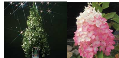
クリスマスエリカ

山梨県では、洋ランやオリジナル花きなど気象条件や技術を生かした高品質な花が生産されています。12月に雪のような白い花を咲かせる「クリスマスエリカ」とともに、富士山のような円すい形の花や花色変化が特徴の「ピラミッドアジサイ」なども新たに注目されています。