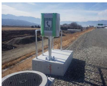
非常電話機の設置