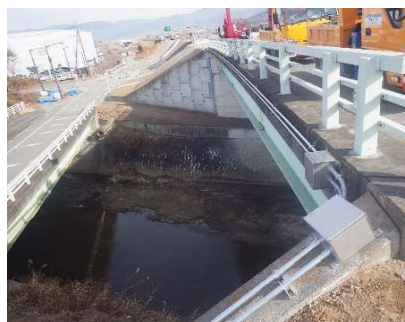
電気設備配管の設置