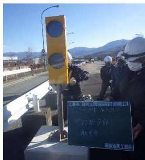
視線誘導灯の設置