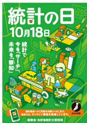
【令和7年度ポスター】