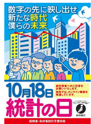
【令和元年度ポスター】