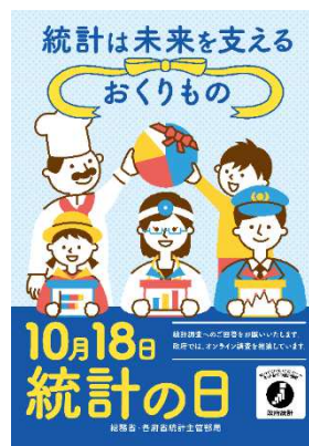
【令和5年度ポスター】