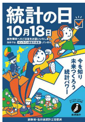
【令和6年度ポスター】