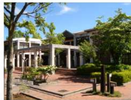
北社市 清里フォレスト (FOR'rest)