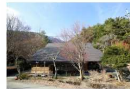
富士河口湖町 古民家宿rootfield