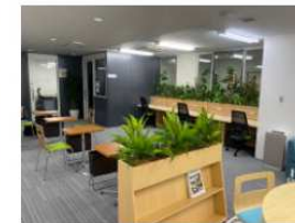
韮崎市 コワーキングスペース&サテライトオフィス HiroBa