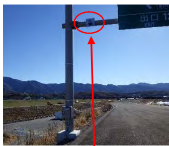
路面監視カメラの設置