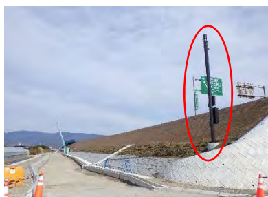
引込分電盤、引込柱の設置