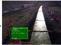
基礎コンクリート打設完了