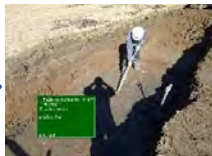
基礎砕石敷均し状況