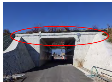
電気設備配管の設置