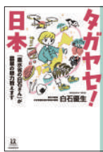
『タガヤセ！日本』 白石優生／著 河出書房新社 ¥1,420 (税別)

時は平安時代。右大臣、藤原実資の娘の千古姫は、女性が成人になる儀式「裳着」が近づいていた。新しい衣装の布を見た姫は、源氏物語の衣装の再現を思いつき…。目次の「かさねの色目」で色の組み合わせを見ながら読むとわかりやすい。