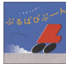
『ぶるばびぶーん』 ささきしゅん／作 福音館書店 ¥1,000 (税別)

「びーか・ぶー！」「おった・かっくん！」「きーけ・ぶー！」両手で顔を隠し、パッと顔を見せる遊びで唱えるこれらの言葉の意味は何だろう？答えは3つとも全て同じ。世界の「いない・いない・ばあ！」に出会える絵本。