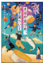
『さばの缶づめ、宇宙へいく』 小坂康之／著 林公代／著 イースト・プレス ¥1,500 (税別)

太宰治、芥川龍之介など、教科書で名前を目にする著名な作家たちは、10代をどのように過ごし、何に影響を受けたのか、当時の日記や著書を用いてひもとく。文学に興味がある人だけでなく、人生の岐路で悩む中高生に手に取ってほしい一冊。