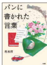
『パンに書かれた言葉』 朽木祥／作 小学館 ¥1,400 (税別)

祐は視覚支援学校で同じクラスの双葉が転倒事故後に不登校となり心配している。自らは、友人関係の葛藤や白杖歩行への不安も抱える。視覚に障害のある二人が世界をどう見ているのか、外出時の恐怖をどう乗り越えて成長するかを描く物語。