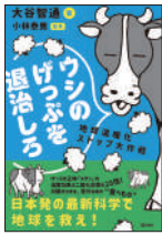
『ウシのげっぶを退治しろ』 大谷智通／著 小林泰男／監修 旬報社 ¥1,600 (税別)

ウシのげっぶに含まれ、地球温暖化に影響するメタン。メタン問題の研究者と、塗料の原料として輸入された「あるもの」が奇跡的に出会い、メタン削減飼料が生まれた。この飼料の話を中心に牛の生態、未来の畜産、新たな温暖化対策を学べる。