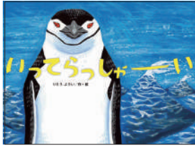
『いってらっしゃーい』 りとうようい／作・絵 金の星社 ¥1,400 (税別)

家族のために、命がけで魚を取ってくるペンギンのお父さんが主人公。魚の群れを発見し、どっさり獲物を得て帰ろうとすると、何匹ものアホウドリに魚を横取りされ、その後、アザランにも襲われ…。海の中には危険がいっぱい！