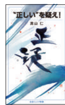
『“正しい”を疑え！』 真山仁／著 岩波書店 ¥860 (税別)

日本の農業の「今」を「国家公務員YouTuber」の視点で発信！機械化と技術の高さにより超優秀な日本の農畜産物から、食品ロス・食料自給率などの問題にまで目を向け、農業の未来を語る。生きるために不可欠な「食」を支える農業の魅力が満載。