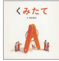
『くみたて』 田中達也／作 福音館書店 ¥1,400 (税別)

小さな家に暮らし、朝から晩までまめめしく働くえんどうまめばあさんと、そらまめじいさんの忙しく、楽しい一日が描かれている。「『暮らす』ということが大事」と言う作者の思いが詰まった一冊。