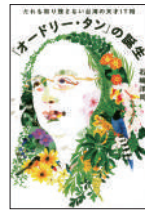
『「オードリー・タン」の誕生』 石崎洋司／著 講談社 ¥1,500 (税別)

「鳥や魚は自由に行き来できるけれど、船や飛行機では自由にこえられない線」、国境。人が決めた線であるが故に、検問所や壁など閉ざされた国境もあり、国同士の関係性も読み取れる。日本では意識しづらい国境について詳しく学べる。