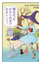
『魔女だったかもしれないわたし』 エル・マクニコル／著 榎田理絵／訳 PHP研究所 ¥1,400 (税別)

いじめや進路に悩む中学3年の陸と、母の再婚相手の家で居場所がないと感じる中学2年の美雨が、「金継ぎ」をきっかけに大切なものや人に出逢う。迷っても自分のペースで進めばいい、と背中をそっと押してくれる一冊。