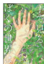
『手で見るぼくの世界は』 樫崎茜／作 酒井以／画 くもん出版 ¥1,400 (税別)

「スポーツにかけた時間と努力」は「貴重な財産」。競技者以外のスポーツに関わる仕事を、実例で多数紹介。現場で働く先輩の声、進路の選び方などスポーツ大好き中高生に向けた情報が満載。未来を切り開くヒントが見つかるはず！