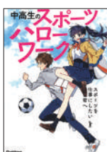
『中高生のスポーツハローワーク』 中高生のスポーツハローワーク編集部／編著 Gakken ¥1,800 (税別)

自分や世間が当然だと思っていることは、本当に「正しい」のか。著者は現代社会の裏側を鋭く描き出す小説家。SNSやメディアから発信される多数の情報をうのみにする危険性を説きながら、情報を見極める方法を記した一冊。