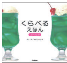
『くらべるえほん たべもの』 ちかつたけお／作・絵 Gakken ¥1,300 (税別)

洗濯ばさみがブランコに変身するなど、様々な日用品や食べ物を、建物や遊具、電車などに見立てるミニチュア写真の絵本。細かい部分まで作りこまれており、組み立てたものが何に変身するのか、想像力をかきたてられる。