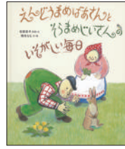
『えんどうまめばあさんと そらまめじいさんのいそがしい毎日』 松岡享子／原案・文 降矢なな／文・絵 福音館書店 ¥1,200 (税別)

家族のために、命がけで魚を取ってくるペンギンのお父さんが主人公。魚の群れを発見し、どっさり獲物を得て帰ろうとすると、何匹ものアホウドリに魚を横取りされ、その後、アザランにも襲われ…。海の中には危険がいっぱい！