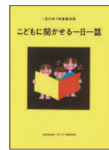
『こどもに聞かせる一日一話』 福音館書店「母の友」編集部／編 福音館書店 ¥1,500 (税別)

左右のページに並んでいる二つのよく似た食べ物。でもよく観察してみると、何か違っている。どこが違うか、自由に考え答えてみよう。食べ物への興味を広げ、考える力を育む、違い探しの絵本。