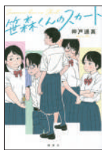
『笹森くんのスカート』 神戸逢真／著 みずす／絵 講談社 ¥1,400 (税別)

ITを活用した素早い感染症対応で世界から注目された台湾のIT相オードリー・タン。優れた才能を持ち、15歳で起業するなど、恵まれて見えるが、いじめや体罰で不登校となった過去があった。困難の中で今も歩み続けるオードリー・タンの伝記。