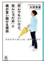
『「死んでもいいけど、死んじゃだめ」と僕が言い続ける理由』 大空幸星／著 河出書房新社 ¥1,420 (税別)

2020年に野口聡一宇宙飛行士が宇宙で食べ話題になった「サバ醤油味付け缶詰」。生徒の何気ない一言から始まった「宇宙食さば缶」作りが、どのように行われ、その後JAXAに正式認証されたのか。福井県立若狭高校の生徒たちの努力を描いた一冊。