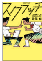
『スクラッチ』 歌代朔／作 あかね書房 ¥1,500 (税別)

悩みがある時や「望まない孤独」に陥った時は、人に相談をして欲しい。問題が整理でき、解決に向かうことがある。著者の子どもの時代のつらい経験と、人の悩みを24時間チャットで聞く現在の活動から生まれた、中高生に伝えたいメッセージ。