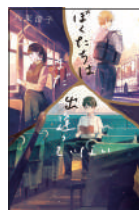
『ぼくたちはまだ出逢っていない』 八束澄子／作 ポプラ社 ¥1,400 (税別)

現代の中高生は、身近な人から戦争体験を聞く機会があるだろうか。主人公エリーは日本とイタリア、双方の祖父母から、戦争を学ぶ。祖父母も孫に伝えることで、戦時中からの想いを昇華させていく。戦争体験を次代へ引き継ぐ物語。