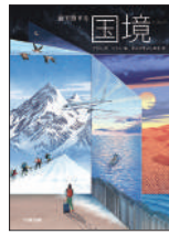
『絵で旅する国境』 クドル／文 ヘラン／絵 なかやまよしゆき／訳 文研出版 ¥2,500 (税別)

ウシのげっぶに含まれ、地球温暖化に影響するメタン。メタン問題の研究者と、塗料の原料として輸入された「あるもの」が奇跡的に出会い、メタン削減飼料が生まれた。この飼料の話を中心に牛の生態、未来の畜産、新たな温暖化対策を学べる。