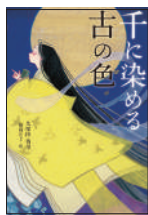
『千に染める古の色』 久保田香里／著 紫昏たう／絵 アリス館 ¥1,400 (税別)

時は平安時代。右大臣、藤原実資の娘の千古姫は、女性が成人になる儀式「裳着」が近づいていた。新しい衣装の布を見た姫は、源氏物語の衣装の再現を思いつき…。目次の「かさねの色目」で色の組み合わせを見ながら読むとわかりやすい。