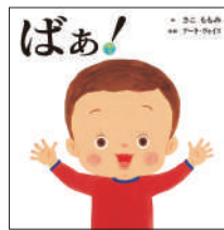
『ばあ！』 さこももみ／作 アーキ・ヴォイス／監修 マイクロマガジン社 ¥1,400 (税別)

みずきは隣に越して来た男の子に勇気を出して挨拶したが、男の子は両手の人差し指を曲げるばかり。実は男の子は手話で挨拶をしており…。違いを知り、手話を学ぶことで、互いに理解し合える事を気づかせてくれる一冊。