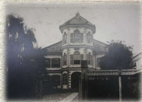
戦前の徴典館（今の山梨大学）