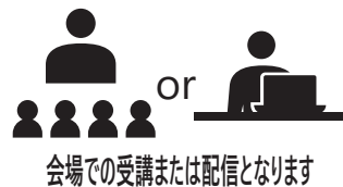
会場での受講または配信となります

◆本講座は会場受講の他、オンライン受講 (zoom) が可能です。裏面のお申込方法をご確認 の上、会場かオンラインでの参加かをご連絡くだ さい。また、新型コロナウイルスの感染状況によっ ては、オンラインのみになる可能性がありますの で、何卒ご了承下さい。