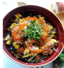
サーモンの漬け丼

★魚をさばこう! あじを三枚におろして、 『つみれ汁』 ★サーモンのフィーレから、 『バラちらし丼』