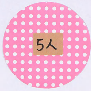
メディアセンター