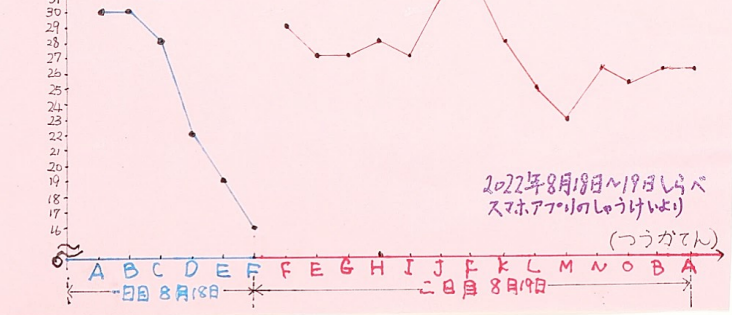
こうかてんごのきおんのへんか