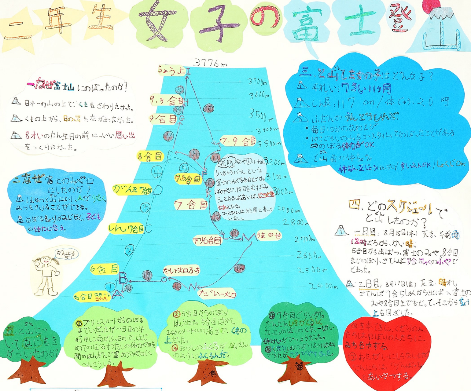
じいさにかかると山時間とコスタイムのひかく