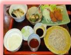
ヒレカツそばセット