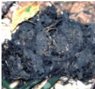
[クマのフン] 直径3cm以上