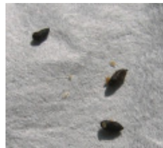
[ネズミのフン] 長さ0.5~1cm

これらのフンは被害を受けたほ場の中に見られない場合もあります。畑に続く獣道を山林へさかのぼると、フンや足跡を効率よく見つけることができます。