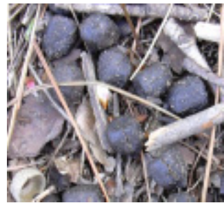
[シカのフン] 直径2cm以下で銃弾状