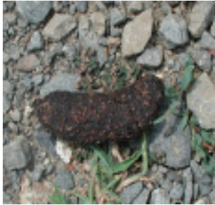
[サルのフン] 直径が2~3cm程度