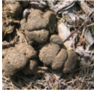
[イノシシのフン] 直径3cm以上