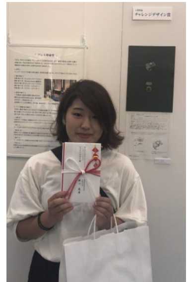
表彰式（平成30年7月20日 東京都千代田区 山脇ギャラリーにて）