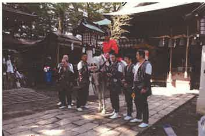
ウマヌシ (夕馬) とウマカタ