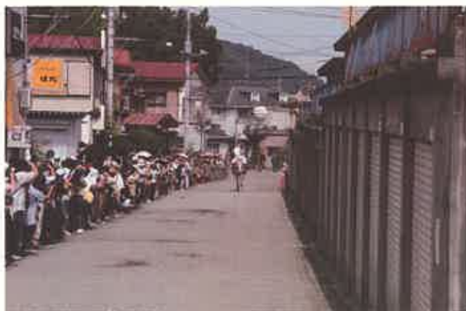
アサウマのウマツトバシ