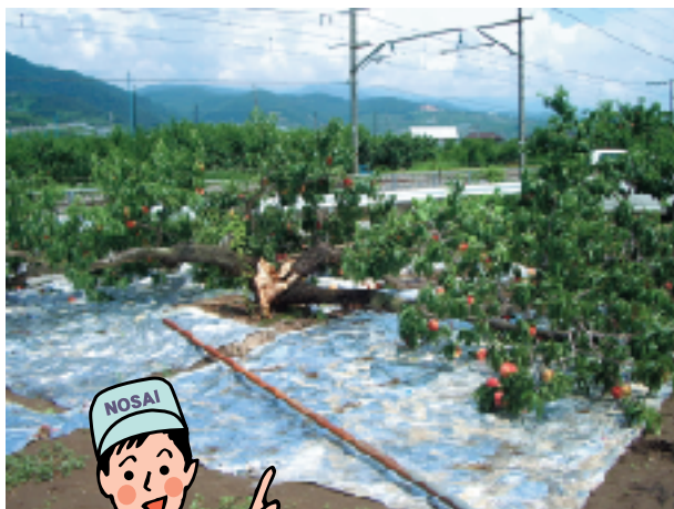
●平成18年7月 暴風で折れたモモ