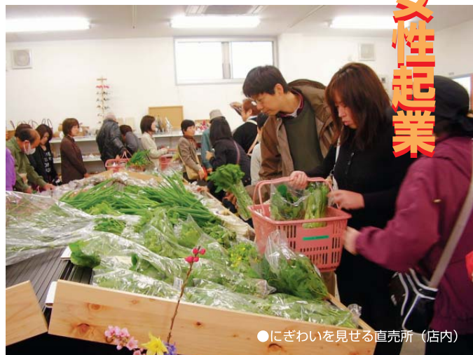
●にぎわいを見せる直売所(店内)