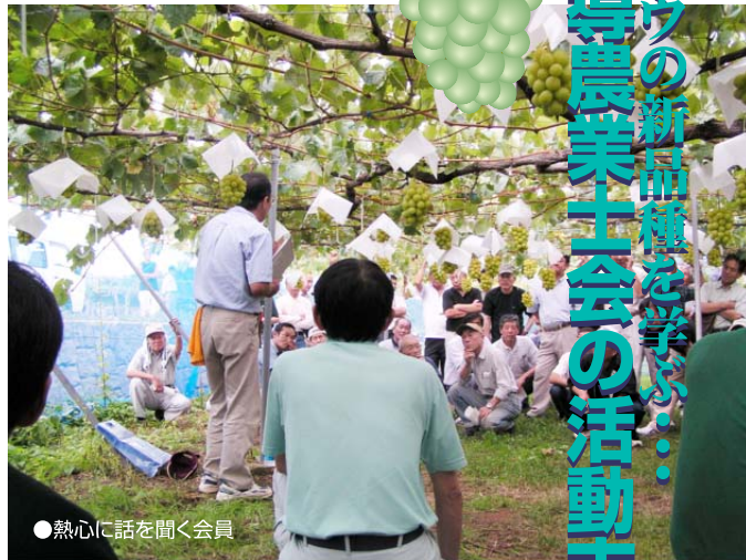
●熱心に話を聞く会員