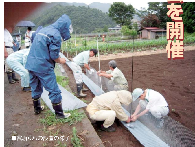
●獣堀くんの設置の様子