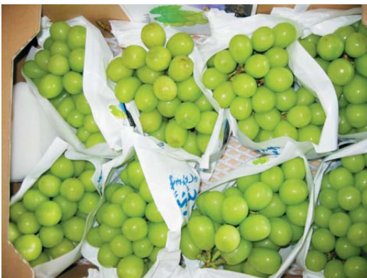
●オリジナル包装資材による試験販売

「シャインマスカット」は、(独)農業・食品産業技術総合研究機構果樹研究所が育成した黄緑色、大粒(12~14g)のブドウで、今注目されている品種です。ジベレリン処理により、種なしとなり皮ごと食べられます。