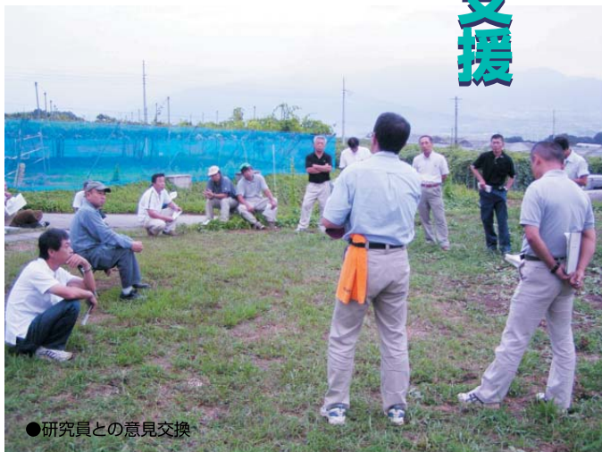
●研究員との意見交換