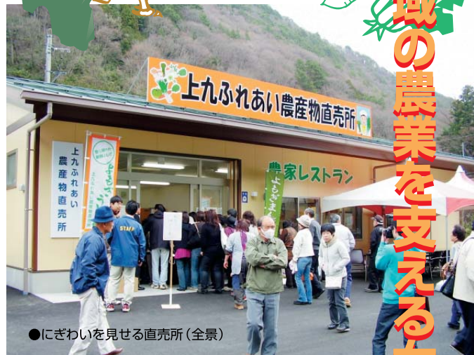
●にぎわいを見せる直売所(全景)