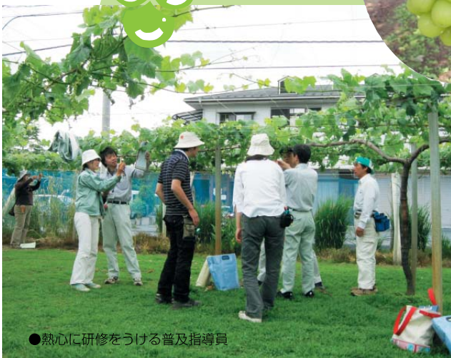
●熱心に研修をうける普及指導員