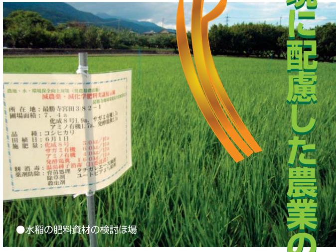
●水稻の肥料資材の検討ほ場