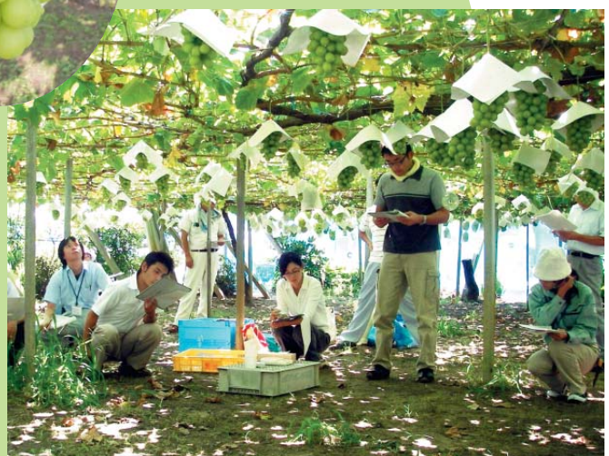
●現地での果実品質調査の様子