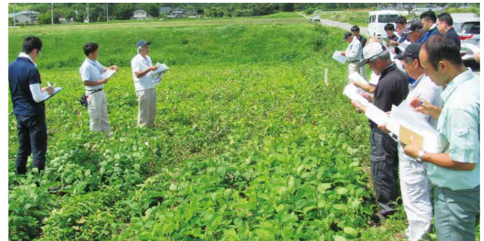
除草剤現地試験検討会

当センターでは、今年度、生産者ごとの除草体系に新規除草剤を組み入れた、新たな除草体系の現地実証試験を実施しています。7月26日は、北杜市内の3圃場で、大豆除草剤現地試験検討会を開催し、大豆生産農業法人、JA関係者など46名が参加しました。検討会では、新規除草剤の防除効果や薬害の程度、散布方法やタイミングについての確認を行いました。