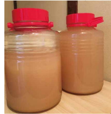
上澄みを取り再度発酵