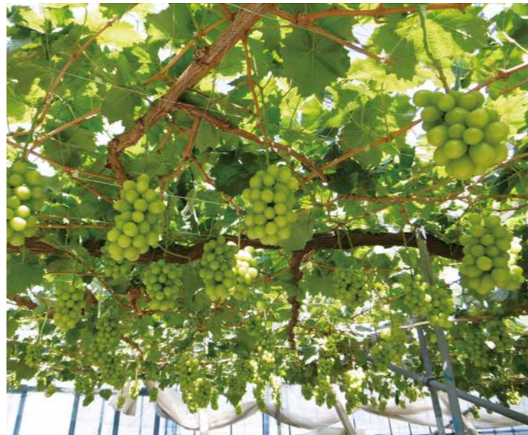
ハウスシャインマスカットの高品質・安定生産