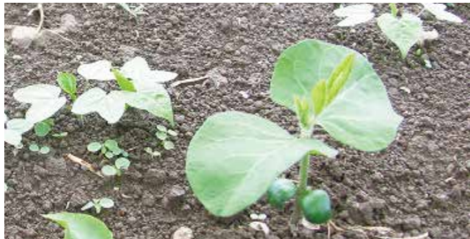
マルバルコウの発生状況