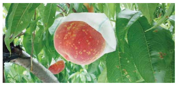
収穫果における被害