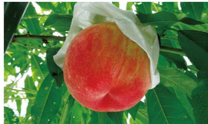
都留市で7月に初収穫となったモモ

当普及センターではこれからも、富士東部地域の特徴を活かした農業振興と経営規模を拡大する農家、新規就農者等農業の担い手を確保する取り組みを支援していきます。