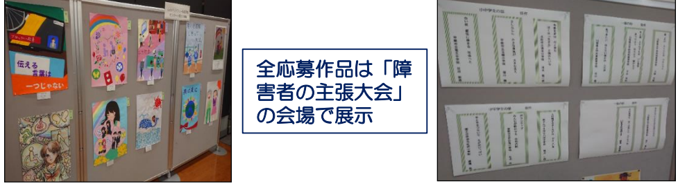
全応募作品は「障害者の主張大会」の会場で展示