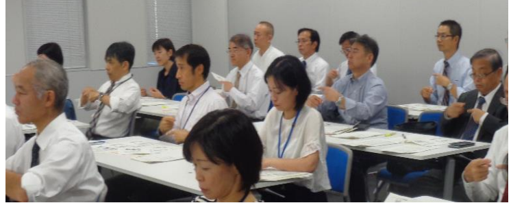
【手話を学ぶ県の管理職等】

県の管理職等を対象とした「心のバリアフリー推進講座」を10月7日～18日の間計4回開催し、対象者の7割を超える107名が受講しました。 ○ 主な内容 1 障害者差別解消法等での公務員の責務・不当な差別に関する事例の学習 2 障害者への配慮(視覚や聴覚に障害のある方による講話等) ① あいさつ等の簡単な手話表現についての研修 ② 盲導犬ユーザーや視覚障害者に必要な支援に係る講話 ※ 県では、障害を理由とする差別の解消を推進するため、各所属の管理職等を「心のバリアフリー推進責任者」として設置しています。