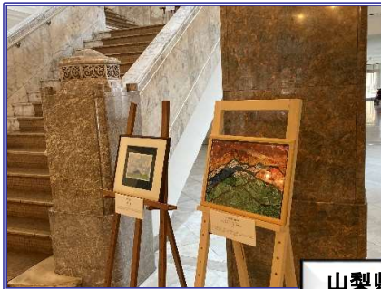
山梨県庁で展示された様子