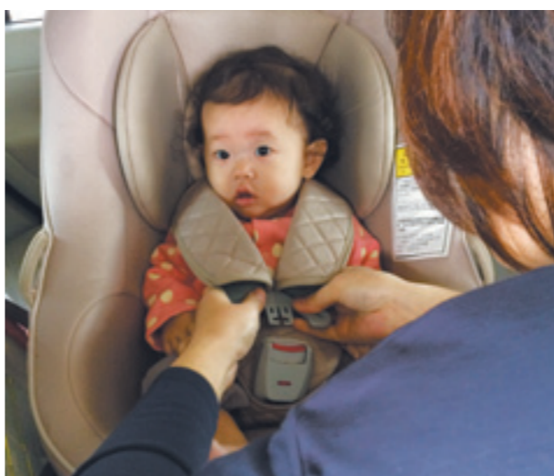
出かける前にはチャイルドシートの確認を!