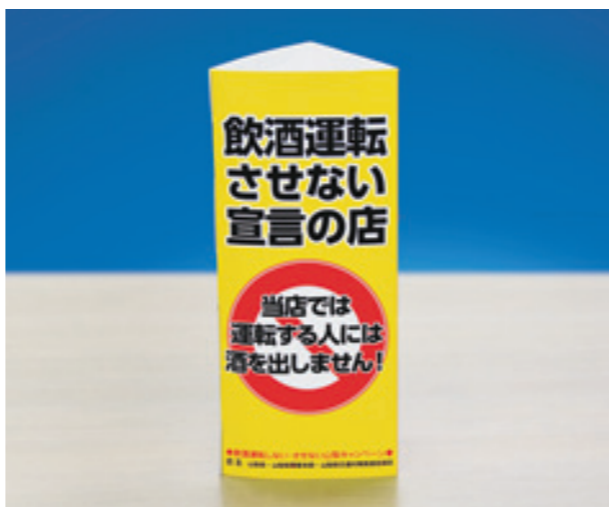
飲食店や酒類販売店などの協力の下、飲酒運転根絶に取り組んでいます

●問い合わせ先/交通政策課 ☎055-223-1353 ☎055-223-1335 山梨 交通安全資料集 検索