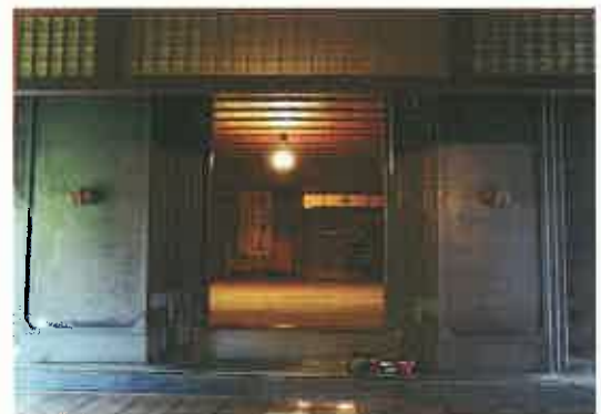
座 敷 蔵