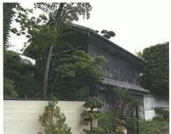
文 庫 蔵