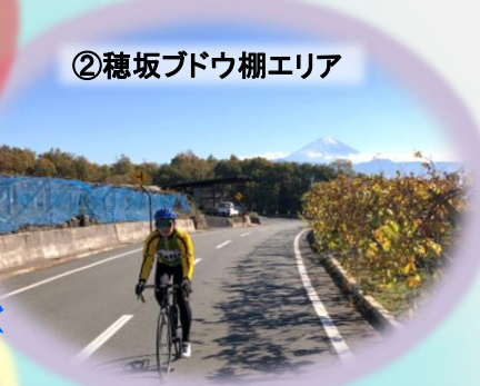
②穂坂ブドウ棚エリア