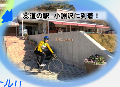
⑥道の駅 小淵沢に到着!