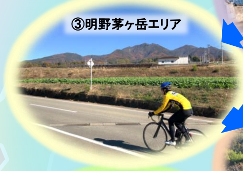
③明野茅ヶ岳エリア