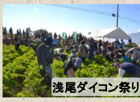
浅尾ダイコン祭り

北杜市明野町では、7~8月に60万本のひまわりが咲き誇り、その後ろには、南アルプス、八ヶ岳、富士山と広大な景色が望めます。11月は浅尾ダイコン祭りが開催され、ダイコンの詰め放題では大勢の方が真剣に袋詰めを行っています。