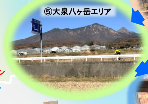
⑤大泉八ヶ岳エリア