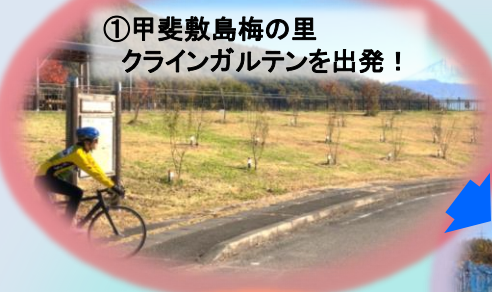
①甲斐敷島梅の里 クラインガルテンを出発!