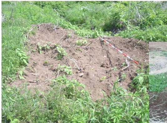
イノシシによる掘り返し跡

サルやイノシシによる被害が発生している。近年は、広域農道下までシカの食害が広がっているため、防止柵を延伸して被害を食い止めたい。