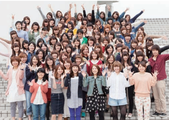
サクセスフルエイジング・プロジェクトに参加する看護学部3年生の皆さん

山梨県立大学 地(知)の拠点 × 山梨県のソーシャルキャピタル醸成事業 (いまいる・スマイル事業)と連携