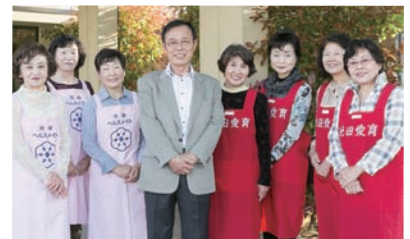
保坂会長と愛育健康づくり推進会、食生活改善推進委員会の皆さん