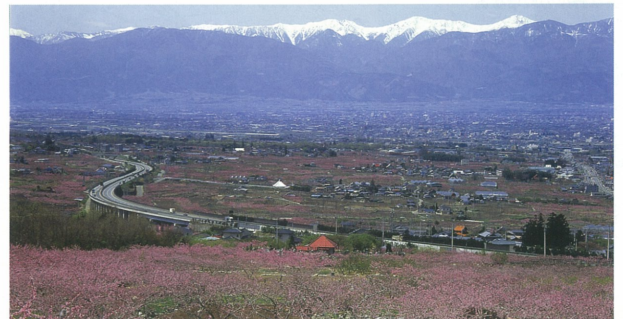
●南アルプスと桃源郷(笛吹市一宮町)