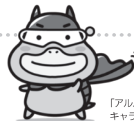
「アルバイトの労働条件を確かめよう！」 キャラクター「たしかめたん」